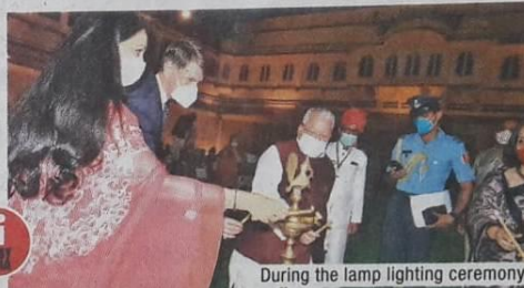
During the lamp lighting ceremony

Mishra. The Guest of Honour was MP Diya Kumari.