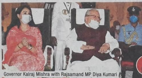
Governor Kalraj Mishra with Rajsamand MP Diya Kumari

The students were introduced to the nuances of opera singing during a two-day workshop organised at The Palace School before the final event. The Chief Guest, on the occasion, was Governor of Rajasthan, Kalraj